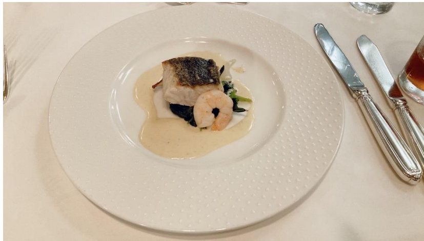
お魚料理 -鮮魚のポワレ 小海老添え 白ワインソース-