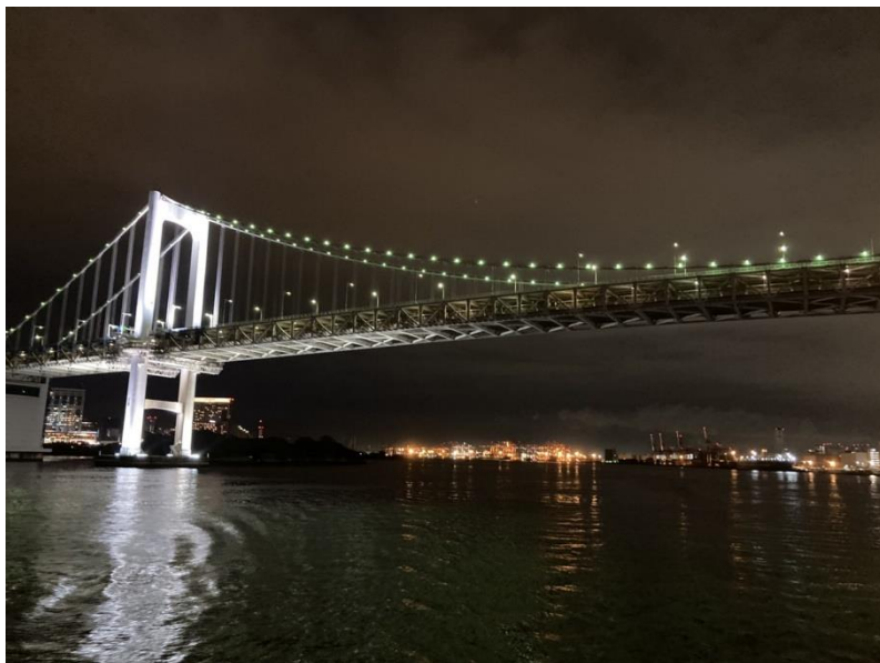
クルーズ船から見たレインボーブリッジ

クルーザーからは、大迫力のレインボーブリッジやカラフルにライトアップされたお台場、東京タワーや東京スカイツリー、東京ディズニーリゾートが一望でき、美味しい食事やきれいな景色を見ながら、よい経験をすることができました。