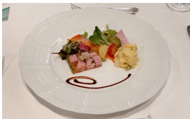
オードブル -前菜 3 種盛り合わせ-

ディナークルーズでフレンチコースをいただきました。 前菜に始まり、ラストはなんと誕生日ケーキのサプライズまで！