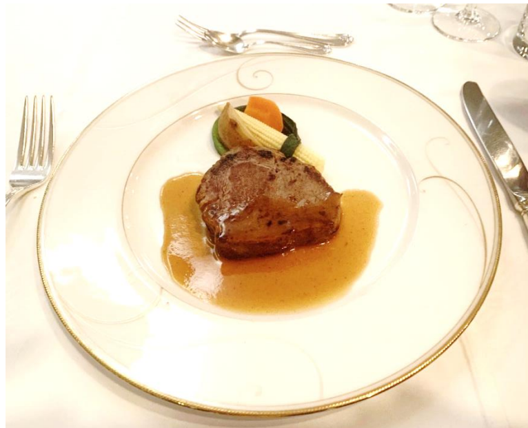
お肉料理 -厳選牛肉のステーキ フォンドヴォーソース 旬の野菜添え-